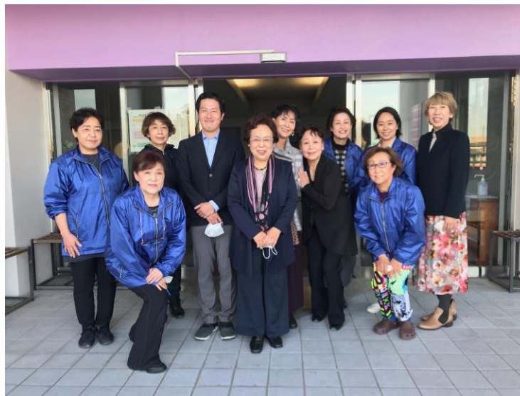
講師の先生方と(講演会終了後)